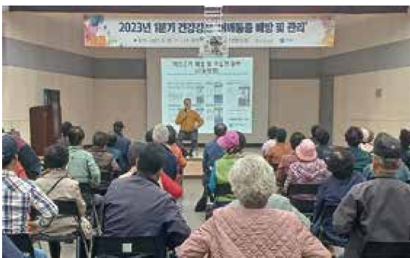
건강강좌 '어깨통증 예방 및 관리'(3.29)