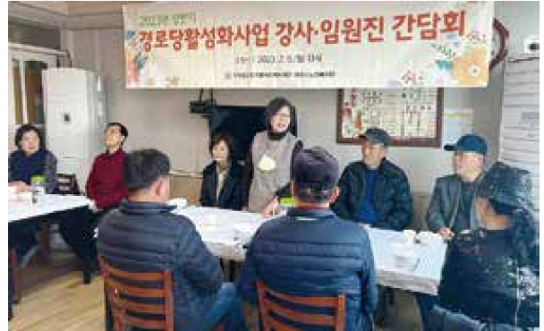
경로당활성화사업 강사·임원진 간담회(2.6)