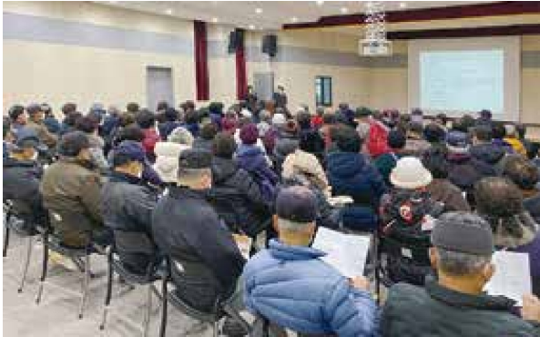
노인사회활동지원사업 공익형 참여자 간담회(2.1/2.2)