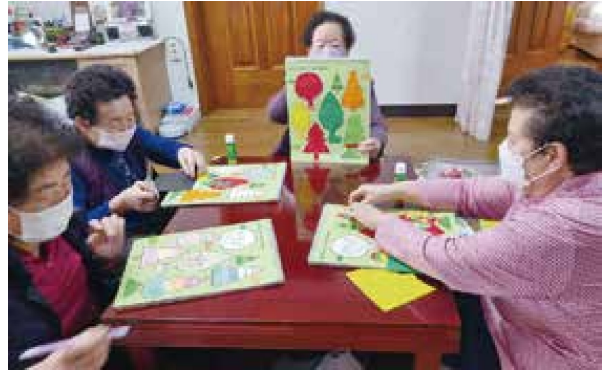
노인맞춤돌봄서비스 집단 생활교육(2.21~2.28)