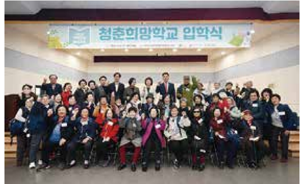
학력인정 문해교육 청춘희망학교 입학식(3.8)