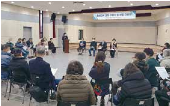
평생교육 강좌 이용자 및 반장간담회(2.8)