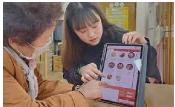
디지털 교육 '내 손안에 세상'(3.29)