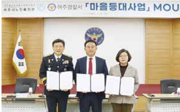
노인일자리사업 사회서비스형 마을등대 MOU 협약식(1.6)