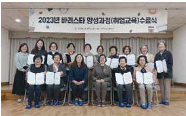
바리스타 양성과정 15기 수료식(3.2~3.28)