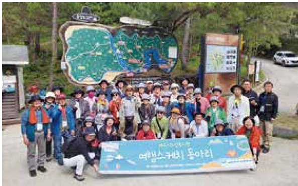
여행스케치 동아리 여행(1.13/2.10/3.10)