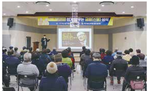
사회문제예방교육 '쉽게 배우는 금융(신용) 상식'(2.15)