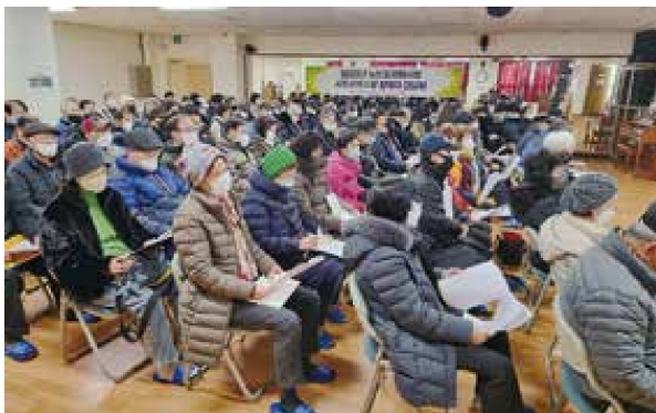
노인일자리사업 사회서비스형 간담회(1.27)