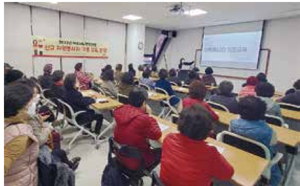
신규 자원봉사자 교육(2.28)