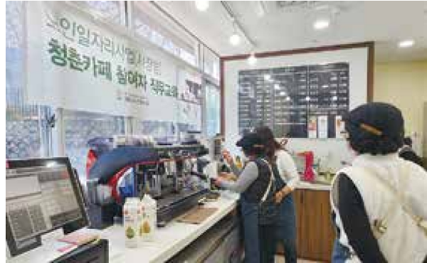
노인일자리사업 시장형 청춘카페 참여자 직무교육(1.9/1.11/1.13)