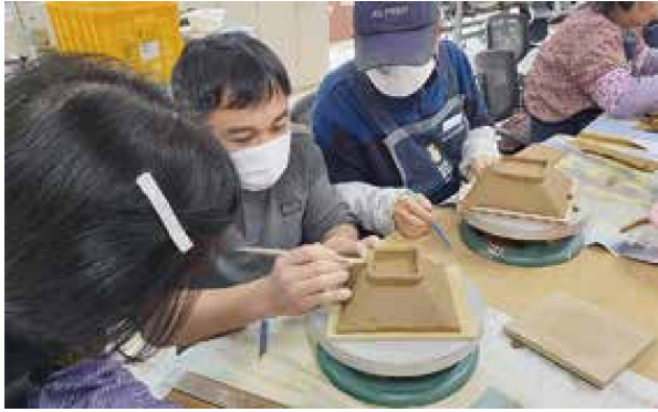
노인일자리사업 시장형 토티람여주도예공방 참여자 직무교육(2.17/2.23)