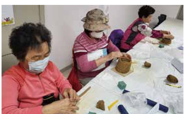
노인맞춤돌봄 특화서비스 집단프로그램 '날마다 청춘'(3.6~3.27)