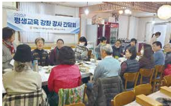
상반기 평생교육 강좌 강사간담회(1.30)