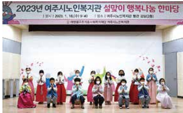
설맞이 행복나눔 한마당(1.18)